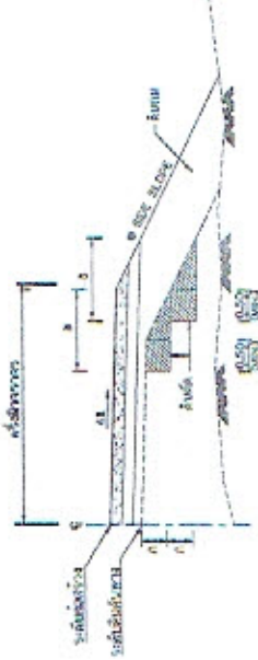
รูปตัดขวางทางลาดลูกรัง